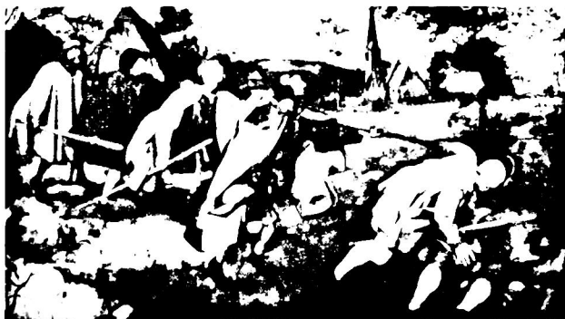
Питер Брейгель «Слепые»

Одним из самых потрясающих художественных выражений такого мироощущения в эпоху кризиса ренессансной культуры была картина Питера Брейгеля «Слепые». Цепочка слепцов, бредущих к обрыву, воспринимается как символ исторического пути всего человечества.