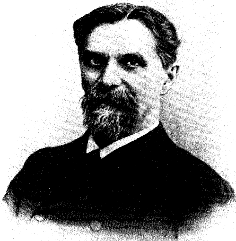
Портрет К. А. Тимирязева